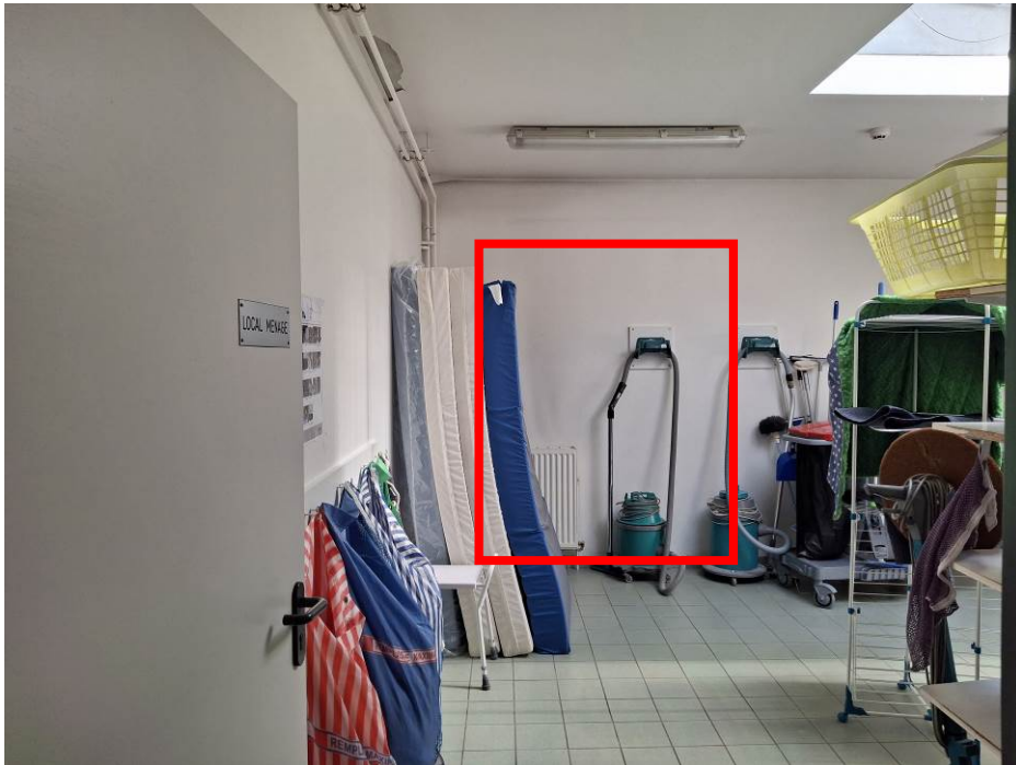
Local ménage actuel D-03 : création porte vers galerie de liaison, redistribution du local D-03...