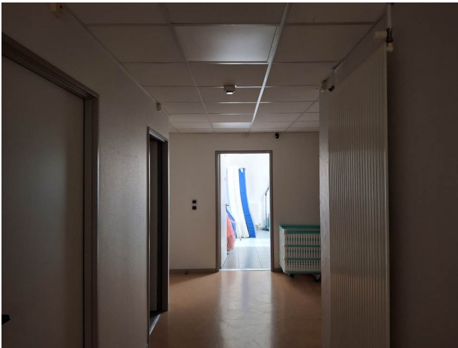
Vue du local ménage D-03 depuis dégagement D-23

3. Couloir-dégagement D-23 à prolonger – aménagements à réaliser dans local ménage D-03 :