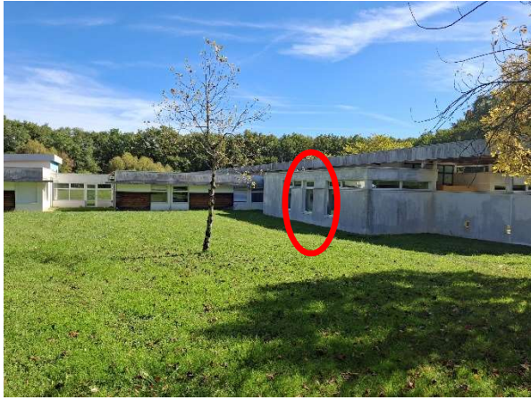
001– Galerie d'entrée

2. Emplacements des liaisons envisagées, à confirmer par le concepteur :