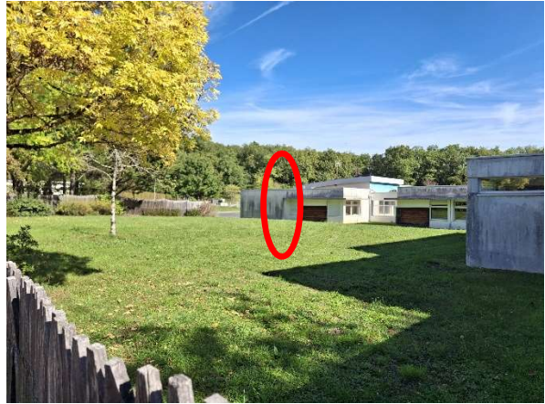
002-Galerie de liaison

3. Couloir-dégagement D-23 à prolonger – aménagements à réaliser dans local ménage D-03 :