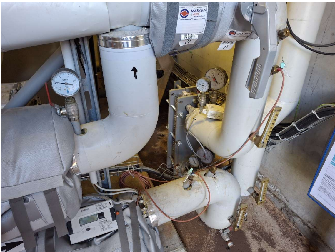
Echangeur thermique existant 90kW. Possibilité d'ajouter des plaques jusqu'à 170kW environ.